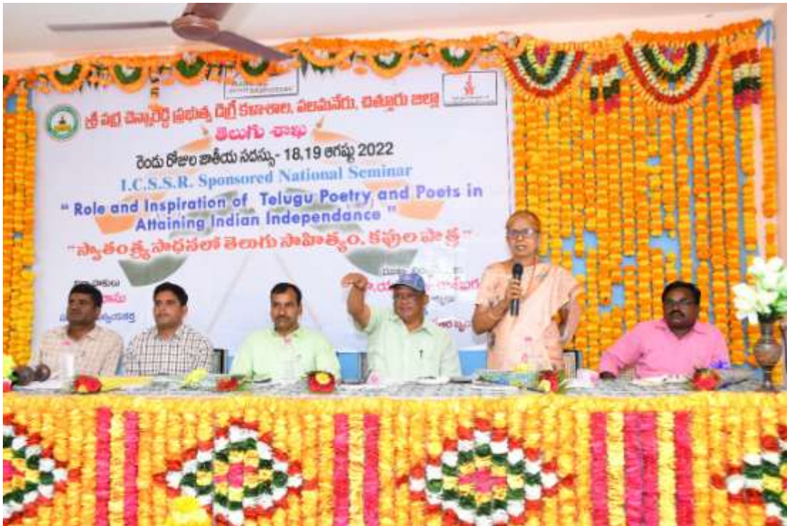
Adders by the Guest Dr.R.Krishnaveni