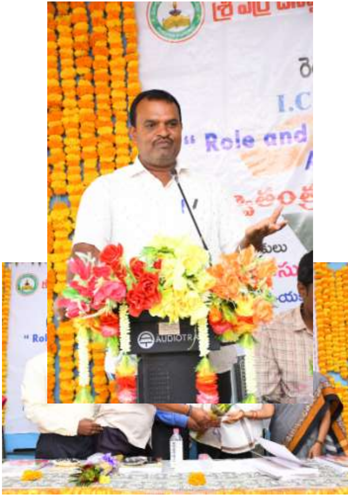
Feed Back by the participants