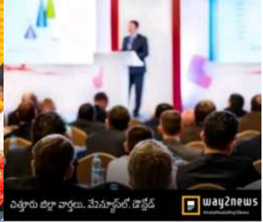
చిత్తూరు డిగ్రీ కళాశాల, మెన్షన్స్లో, డిగ్రీడ్