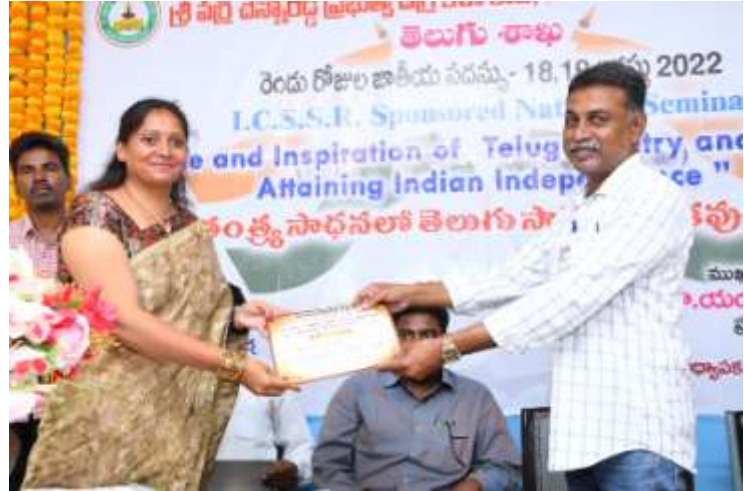
Distribution of Certificates