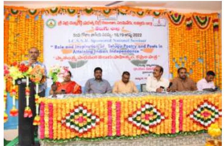
Releasing the Seminar proceeding by the Guest of Honours